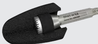
大的定制款防风球