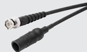
橡胶套包裹的防水线缆